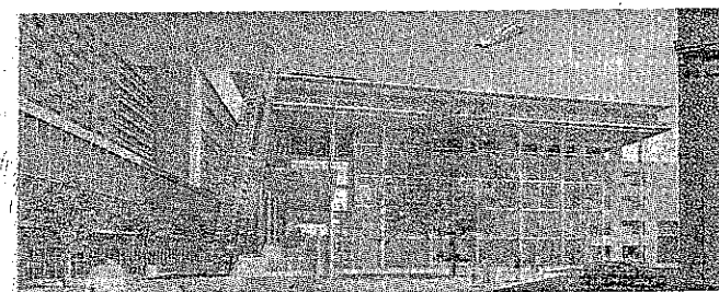
Moderno Ecco come sarà il polo medico-tecnologico di Marsiglia.